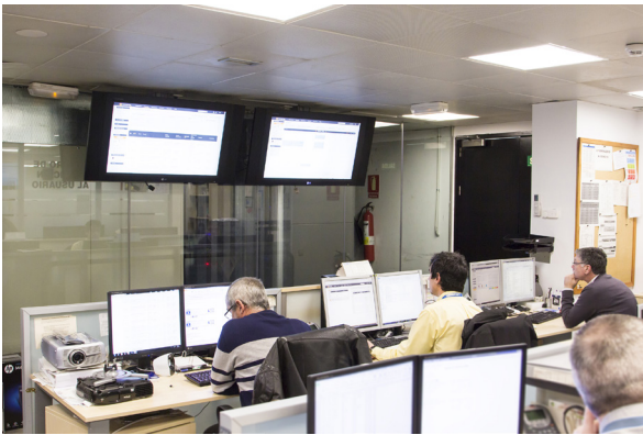
Central Equipo CAU / EMT Madrid

se sienten cómodos trabajando con ello. La interfaz de Integria IMS es cómoda. En la vista general de incidencias la información está agrupada para ayudar activamente a la búsqueda.